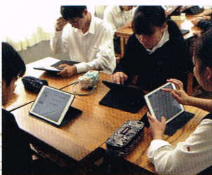
※写真は通常の ICT 授業です。

当日はメイン会場に加えてネットワークで結ばれたサテライト会場も特設。メイン会場でのアクティブラーニングの様子をサテライト会場にも中継し、ICT機材を駆使した三田学園独自のプログラムも実施して、新しい学びを試みます。