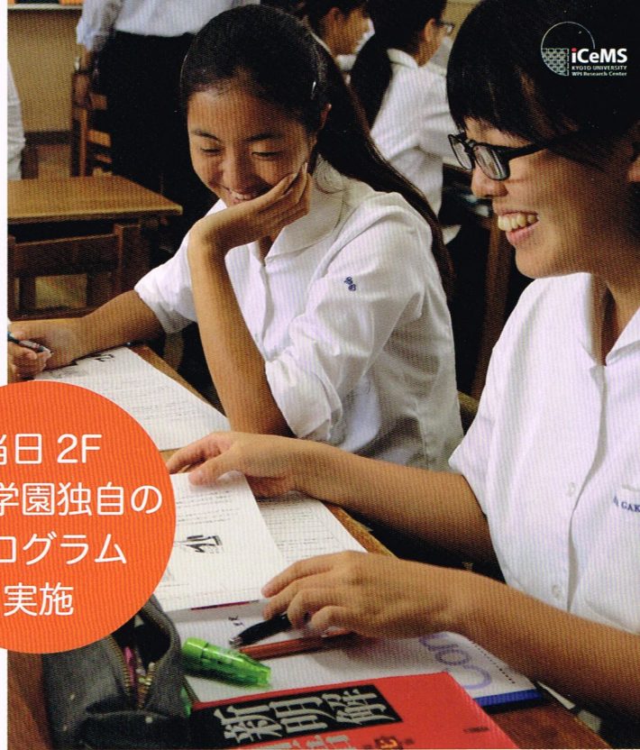
※写真は通常のアクティブラーニング授業です。