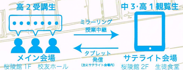
※背景の線画イラストはイベント会場となる本校桜陵館です。

当日はメイン会場に加えてネットワークで結ばれたサテライト会場も特設。メイン会場でのアクティブラーニングの様子をサテライト会場にも中継し、ICT機材を駆使した三田学園独自のプログラムも実施して、新しい学びを試みます。